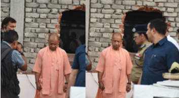
सुरक्षा मानकों का कड़ाई से अनुपालन कराने को कहा था सीएम ने हाइड्राफर भवनों के लिए आवश्यक उपकरणों और संसाधनों के उपलब्धता के लिए भी कहा था। अस्पतालों, होटलों, स्कूलों, औद्योगिक प्रतिष्ठानों और बहुमंजिला भवनों का निम्नित मध्यम आडिटे करने तथा सुरक्षा मानकों का कड़ाई से अनुपालन सुनिश्चित कराने को भी कहा था।