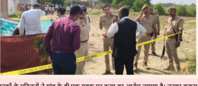
मृतकों के परिजनों ने गांव के ही एक युवक पर हत्या का आरोप लगाया है। उनका कहना है कि आरोपी और परिवार के बीच काफी समय से विवाद चल रहा था।